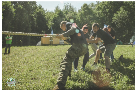
Конкурс «Перетягивание каната»

Я лично, побывав на «Профсоюзной маёвке» - 2018, задаюсь только одним вопросом: «Когда же в следующий раз?!»