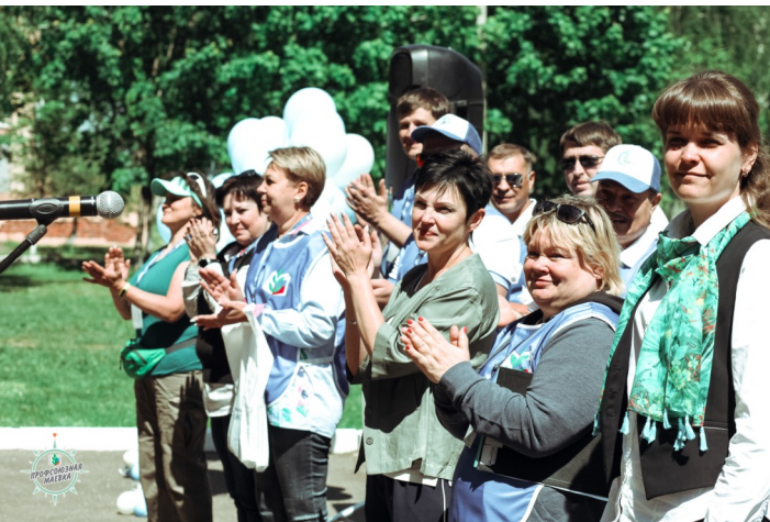
Открытие «ПРОФСОЮЗНОЙ МАЕВКИ»-2018

С 26 по 27 мая в городском округе Домодедово (пос. Красный путь) на территории ДДТ "Ли́ра" прошёл первый спортивно-туристский слёт "Профсоюзная маёвка 2018". В соревнованиях приняли участие 15 команд представляющих местные организации Профсоюза (Балашихинская районная; Волоколамская районная; Долгопрудненская городская; Домодедовская городская; Железнодорожная городская; Можайская районная; Истринская районная; Клинская районная; Коломенская городская; Королёвская городская; Лобненская городская; Мытищинская районная; Орехово-Зуевская районная; Рузская районная; Шатурская районная), в состав которых входило более 170 человек.