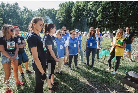
«Конкурс туристской кухни»

Для нас «Маевка» - это масса интересных конкурсов, где педагоги показали свои волевые качества, творческие умения, новые знакомства и огромная поддержка. Наша команда впервые участвовала в туристском слете, а значит были новичками походного дела. Но! По итогам «Маевки» удостоены кубком «За волю к победе». А значит, есть куда стремиться! Эмоций масса, но мнение одно: профсоюз – это молодёжно, весело и дружно!